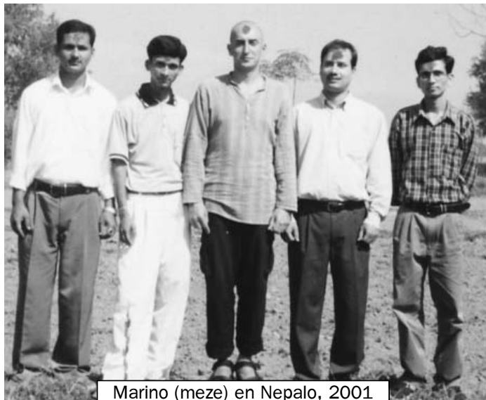
Marino (meze) en Nepalo, 2001

- Feliĉe, mi ne havas problemojn pri ŝuoj, ĉar mi havas du sponsorojn: itala firmao Crispi donadas al mi ŝuojn Monaco , kiujn mi uzas precipe vintre, kaj alia itala firmao, Lizard , donadas al mi sandalojn, kiujn mi uzas ĉefe somere. Ankaŭ pri vestaĵoj mi havas sponsorojn: Coolmax kaj Thermolite , hispan-turka firmao, kaj TRR , itala. Tamen, vi pravas, mi devas lavi de tempo al tempo. Mi faras tion kiam eblas en domoj aŭ hoteletoj, aŭ... fontanoj.